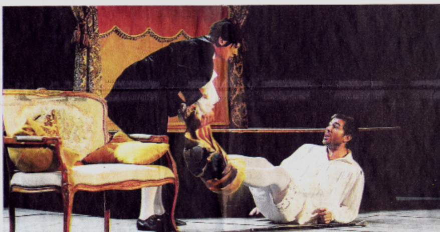
Pas le temps de s'ennuyer avec le rythme de la pièce.

H ier soir à l'Hôtel de Roland, la Compagnie « Les Enfants Terribles » donnait une représentation de son spectacle « Terriblement Molière ». Ce spectacle, inspiré de l'œuvre de Molière, trace une fresque savoureuse des pièces du dramaturge. Un voyage temporel qui