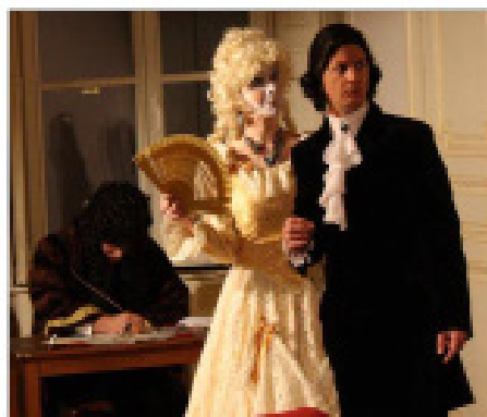
■ Un dispositif scénique original au château Miro-de-Griffigny.