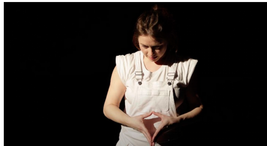
cr. Yann Slama