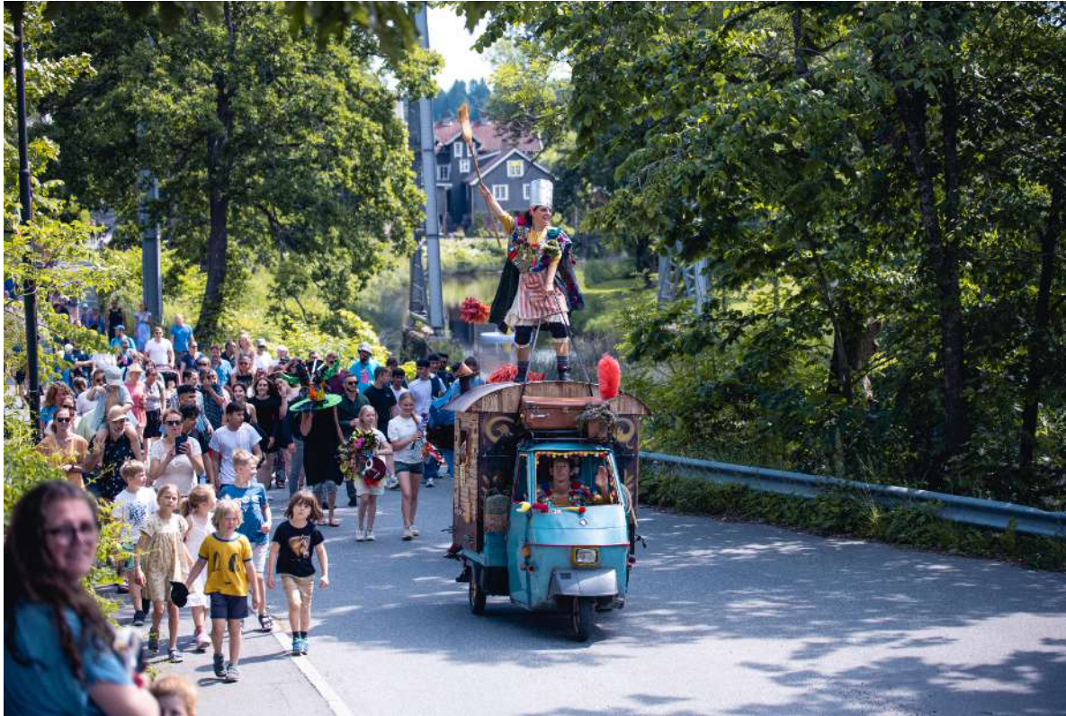
parade à Sånafest