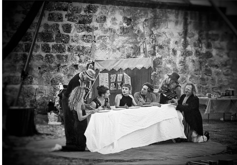
La Sainte Famille